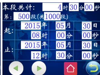
图七 查询结果页面