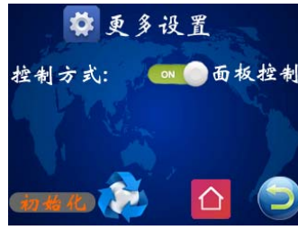
图九 更多设置页面