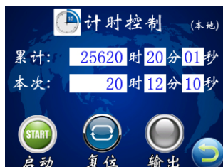
图三 计时控制界面