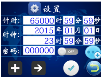
图八 参数设置页面