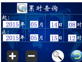
图四 查询条件页面