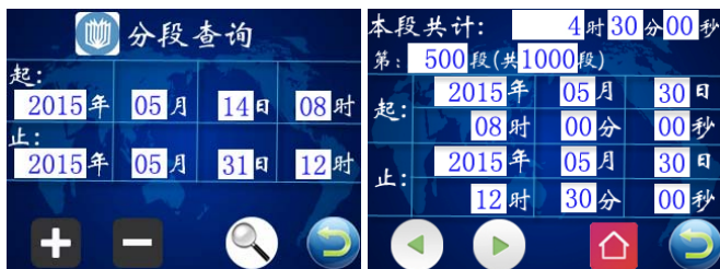
图六 查询条件界面